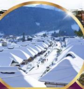
หมู่บ้านโบราณ โออิจิ จุกุ