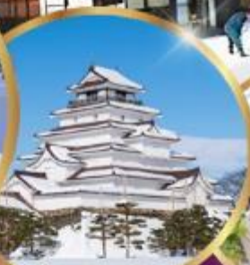
ปราสาท สึรุกะ