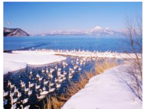
ทะเลสาบอินาวะชิโร Inawashiro-ko