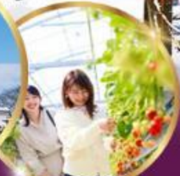
บุฟเฟต์ สดอเบอร์รี่ เก็บสดจากต้น