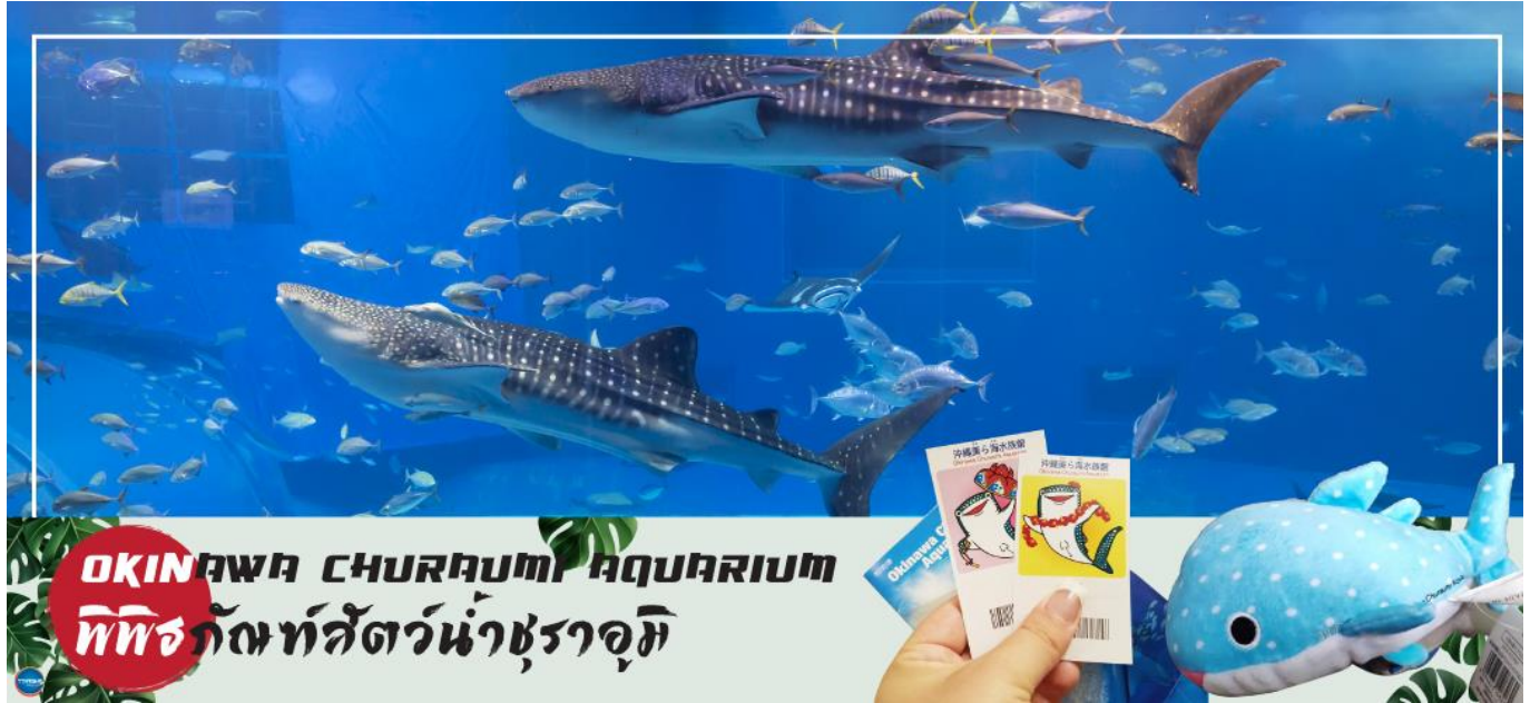
OKINAWA CHURAUMI AQUARIUM พิพิธภัณฑ์สัตว์น้ำชुरาอุมิ

เช้า รับประทานอาหารเช้า ณ ห้องอาหารของโรงแรม (1) นำท่านชม พิพิธภัณฑ์สัตว์น้ำชुरาอุมิ (OKINAWA CHURAUMI AQUARIUM) (ใช้เวลาเดินทางประมาณ 1.40 ชั่วโมง) เป็นพิพิธภัณฑ์สัตว์น้ำที่ดีที่สุดในประเทศญี่ปุ่น ไฮไลท์!!! ของการเยี่ยมชมพิพิธภัณฑ์สัตว์น้ำแห่งนี้คือแท็งก์น้ำคุโรชิโอะ ซึ่งเป็นหนึ่งใน แท็งก์น้ำที่ใหญ่ที่สุดของโลก ซึ่งภายในนั้นเต็มไปด้วยสิ่งมีชีวิตในทะเลแถบโอกินาวาที่หลากหลาย สัตว์น้ำที่โดดเด่นที่สุดคือฉลามวาฬยักษ์ และกระเบนราหู อีสระให้ท่านได้เพลิดเพลินกับสัตว์น้ำหลากหลายชนิด ทั้ง ปลาตาว ฉลาม ฉลามเสือ และฉลามวัว ปลาเรืองแสง ตลอดจนหอยต่างๆ นอกจากนี้ยังมีสระน้ำกลางแจ้งที่ตั้งอยู่ใกล้ริมน้ำซึ่งเป็นที่จัดการแสดงของโลมาแสนรู้ เต่าทะเล และพะยูน ที่จัดขึ้นเพียงไม่กี่ครั้งต่อวัน (ไม่มีค่าใช้จ่ายเพิ่มเติม แต่ต้องตรวจสอบเวลาการแสดงก่อนชมนะคะ)