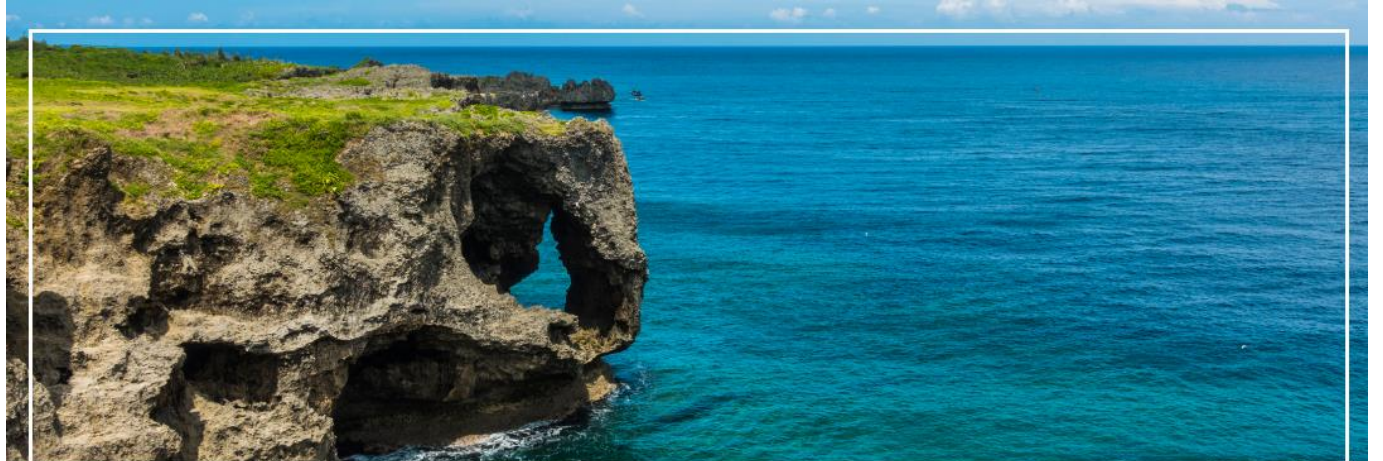
CAPE MANZAMO ผามันซาโมะ

เที่ยง รับประทานอาหารกลางวัน ณ ภัตตาคาร (2)