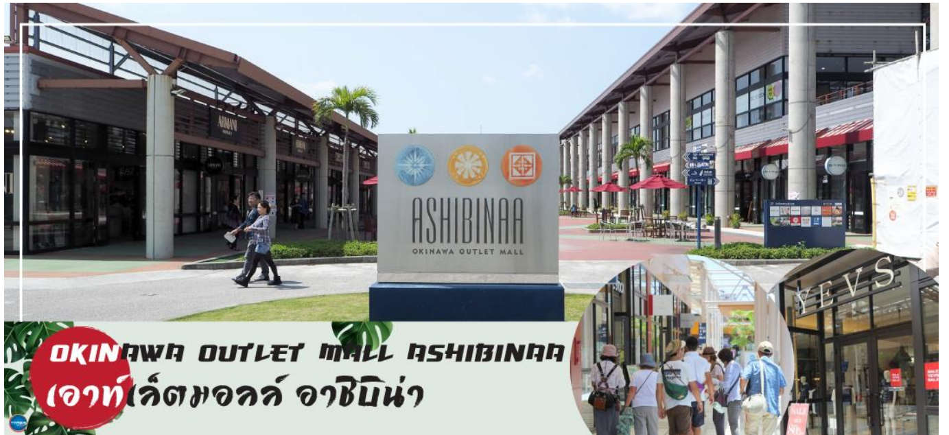
OKINAWA OUTLET MALL ASHIBINAA เอาท์เลตมอลล์ อาชิบิโน่า

เช้า รับประทานอาหารเช้า ณ ห้องอาหารของโรงแรม (5) นำท่านเดินทางสู่ ศาลเจ้านะมิโนะอุเอะ (Naminoue Shrine) (ใช้เวลาเดินทางประมาณ 10 นาที) ตั้งอยู่ ณ บริเวณที่เป็นพื้นที่ศักดิ์สิทธิ์ที่ใช้ในการสวดภาวนาอธิษฐานต่อเทพเจ้าที่สถิตย์อยู่ ณ อาณาจักรเจ้าสมุทรโพ้นทะเลมาแต่ครั้งโบราณ ในอดีตชาวเรือที่เข้าออก ณ ท่าเรือนาสะ (Naha Port) ซึ่งขณะนั้นเป็นศูนย์กลางการแลกเปลี่ยนค้าขายกับนานาประเทศ ทั้งจีน ประเทศทางตอนใต้ เกาหลี และชวายามาโตะ มักจะแหงนหน้ามองขึ้นไปยังศาลเจ้าซึ่งตั้งอยู่บนหน้าผาสูงเพื่ออธิษฐาน และแสดงความขอบคุณ ศาลเจ้านะมิโนะอุเอะได้รับความเสียหายจากการรบในโอกินาวะ (Battle of Okinawa) เมื่อครั้งสงครามแปซิฟิก แต่ได้รับการบูรณะฟื้นฟูในเวลาต่อมาเมื่อสงครามสิ้นสุดลง ปัจจุบันนี้ได้กลายมาเป็นศูนย์กลางแห่งศาสนาชินโตในจังหวัดโอกินาวะ ชาวญี่ปุ่นมักจะมาไหว้ขอพรเกี่ยวกับธุรกิจการงานให้เจริญรุ่งเรือง ร่ำรวย และมาสะเดาะเคราะห์ให้พ้นโชคร้าย จากนั้นนำท่านสู่ เอาท์เลตมอลล์ อาชิบิโน่า (Okinawa Outlet Mall Ashibinaa) (ใช้เวลาเดินทางประมาณ 30 นาที) เอาท์เลตแห่งแรกในโอกินาวะ รวบรวมร้านค้าชั้นนำกว่า 100 ร้าน ทั้งเสื้อผ้าแฟชั่น สินค้าแบรนด์เนม นาฬิกา ข้าวของเครื่องใช้ ของเล่น ทุกร้านจัดเต็มทั้งสินค้านำเข้าและรุ่นใหม่ ลดราคากระหน่ำกว่า 30-80% ให้ได้เดินช้อปปิ้งท้ายทวีปกันอย่างจุใจ ภายใต้บรรยากาศสบายๆ สไตล์รีสอร์ทริมทะเล หากช้อปปิ้งเหนื่อยสามารถขึ้นไปทานอาหารที่ชั้น 2 มีอีกหลายร้านที่คอยให้บริการ