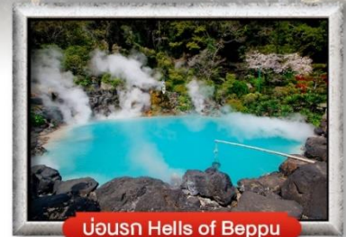
บ่อน้ำ Hells of Beppu

พิเศษ! บุฟเฟ่ต์ซาบู, บุฟเฟ่ต์ปิ้งย่างยากินิกุ