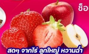
สดๆ จากไร่ ลูกใหญ่ หวานฉ่ำ

เล่นสกีที่ลานสกี • สนุกสนานกับการตกปลาน้ำแข็ง • ชิมปลาเทราส์แผลสด ขอพรที่วัดพงอินชา • คลองกฤษแจ N Tower • เล่นเครื่องเล่นที่สวนสนุกเอเวอร์แลนด์ ชมคลองชองเกซอน • Coex mall • ห้องสมุดสุดชิค Starfield Library ช็อปปิ้งตลาดเมียงดง • ตลาดซองแด • ย่านยอนนัมดง • Hyundai shopping outlet