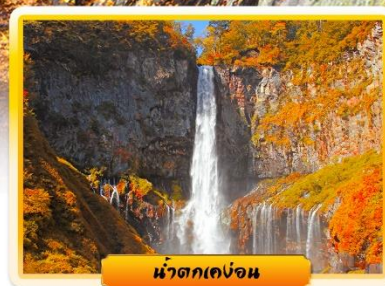
น้ำตกเคงอน