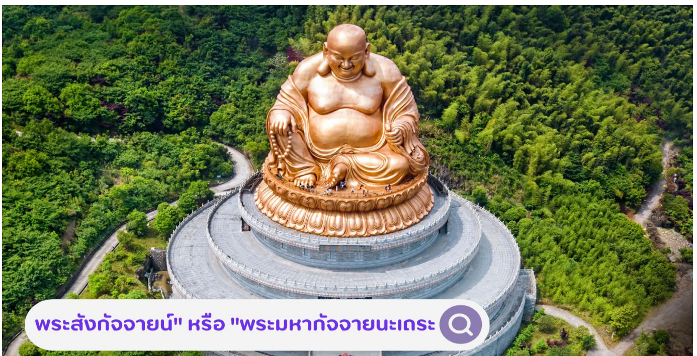
พระสังกัจจายน์" หรือ "พระมหากัจจายนะเถระ

นำท่านชม วัดเสวียโต้วซาน ตั้งอยู่ในเมืองหนิงโป มณฑลฝูเจี้ยน ตั้งอยู่ที่เชิงเขาเซวาทัว (Xuedou Mountain) วัดนี้มีชื่อเสียงในฐานะสถานที่ศักดิ์สิทธิ์สำหรับการศึกษาพุทธศาสนา การและสถานที่ฝึกฝนและปฏิบัติธรรมตามหลักของพระศรีอารยเมตไตรย ซึ่งเป็นพระโพธิสัตว์ที่สำคัญในศาสนาพุทธ ที่วัดมีพระพุทธรูปขนาดใหญ่ที่ตั้งอยู่กลางแจ้ง พระสังกัจจายน์" หรือ "พระมหากัจจายนะเถระ" ขนาด 33 เมตร เมตร มีลักษณะที่งดงามและประณีต พระพุทธรูปนี้สร้างขึ้นด้วยวัสดุที่ทนทานและมีความสวยงามทางศิลปะ เป็นพระโพธิสัตว์ที่สำคัญในศาสนาพุทธ พระองค์เป็นสัญลักษณ์ของความเมตตาและการกรุณา และถูกเคารพสักการะว่าเป็นพระโพธิสัตว์ รอทที่จะมาตรัสรู้เป็นพระพุทธเจ้าองค์ถัดไปเมื่อสิ้นพุทธกาลของสมเด็จพระสัมมาสัมพุทธเจ้า นอกจากนี้ยังมีสถานที่อื่น ๆ ในวัดที่น่าสนใจ เช่น หอพระธรรม พิพิธภัณฑ์ และสวนและทางเดินที่สวยงาม