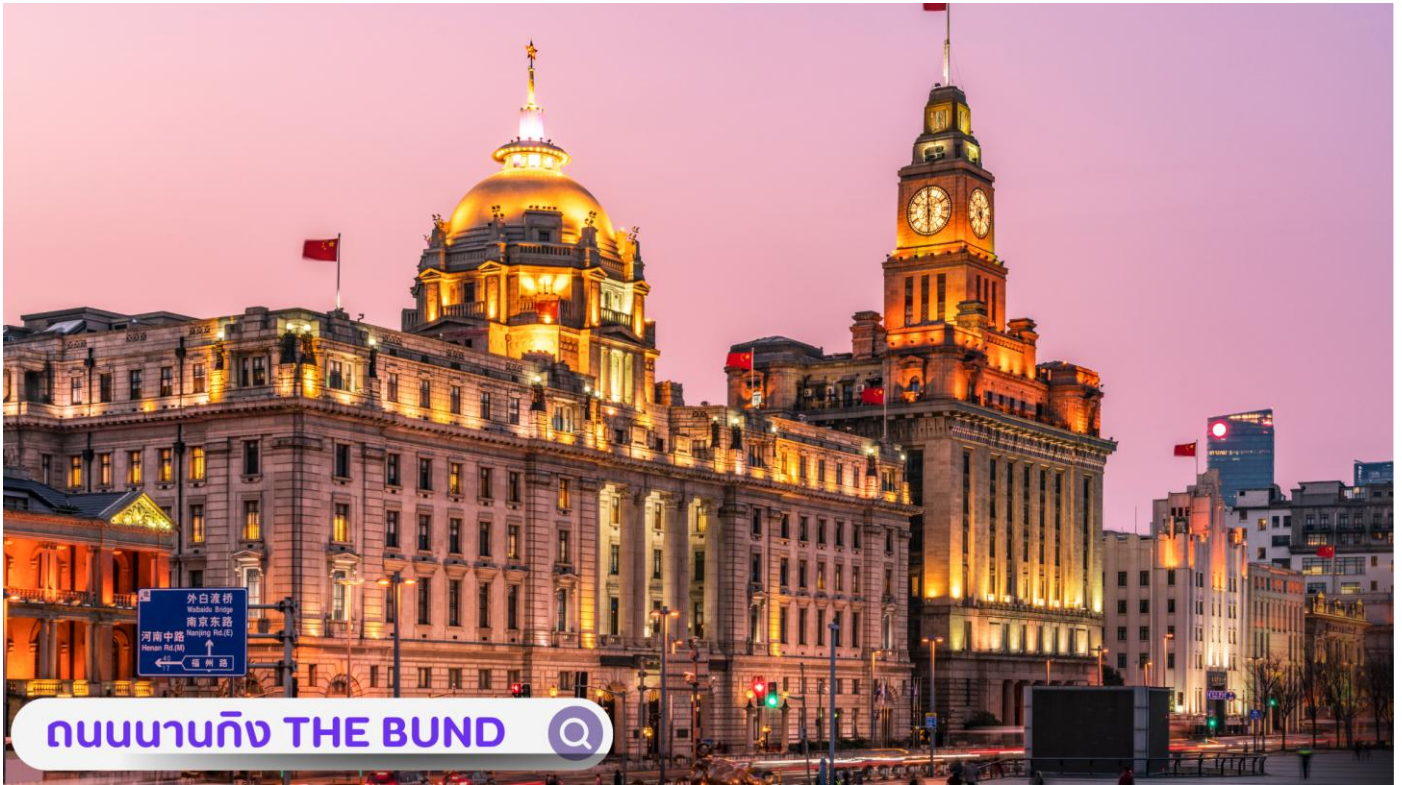
ถนนานกิง THE BUND 🔍