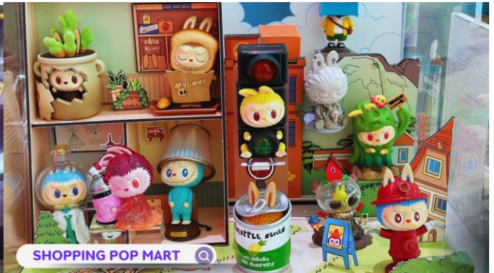
SHOPPING POP MART 🔍