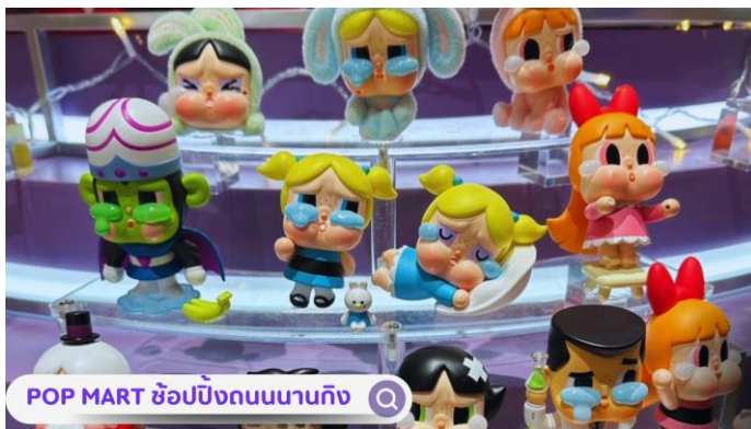
POP MART ช้อบบึงถนนานกิง 🔍