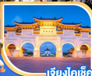
เจียงไคเช็ค