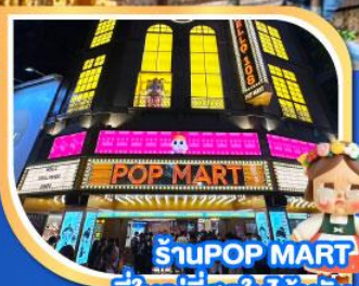
ร้าน POP MART ที่ใหญ่ที่สุดในไต้หวัน