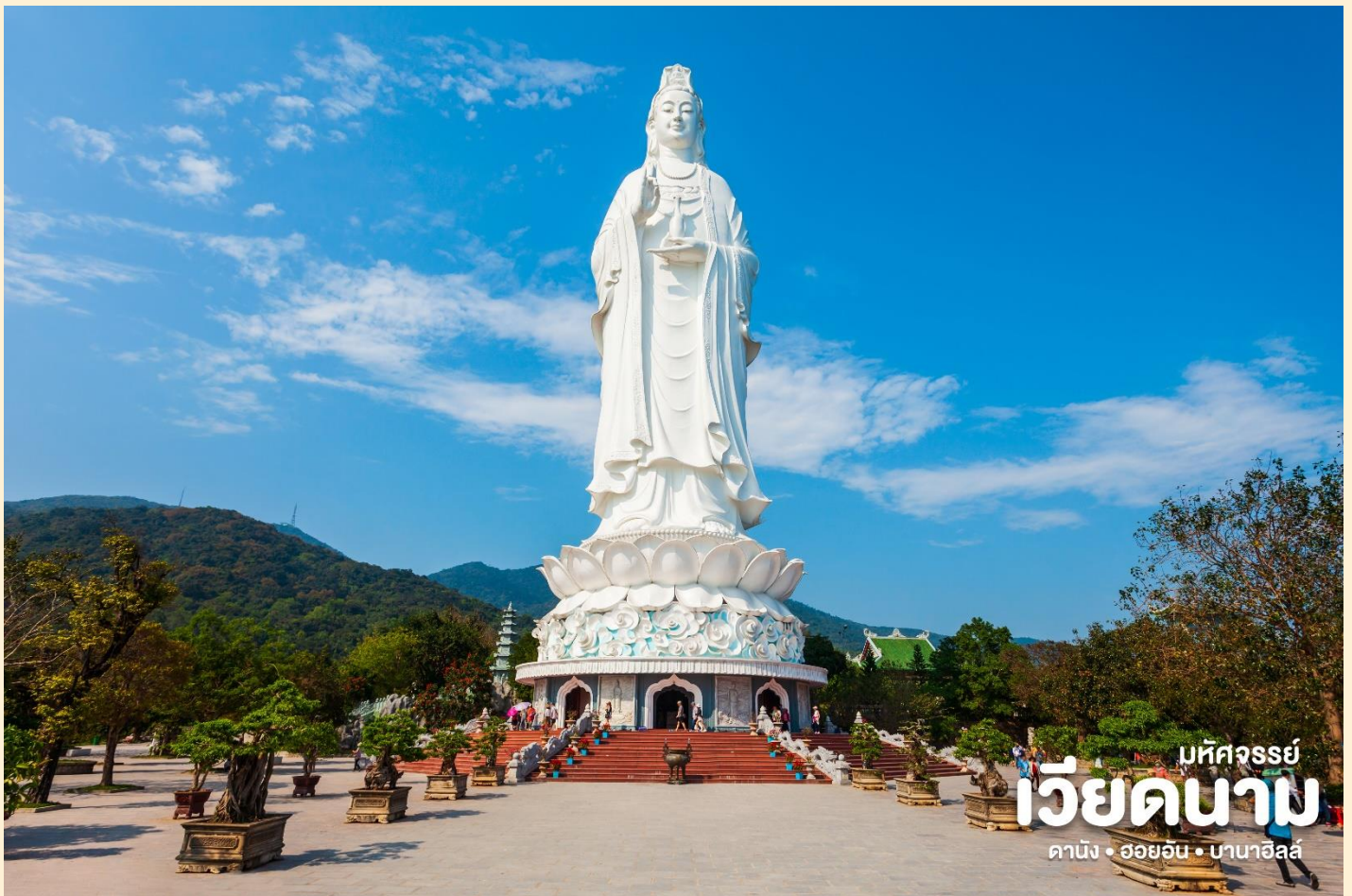
มัทซอร์รี่ เวียดนาม ดานัง • ฮอยอัน • บานาฮิลล์

สักการะ วัดลินห์อิง (Linh Ung) เป็นวัดที่ใหญ่ที่สุดของเมืองดานังภายในวิหารใหญ่ของวัดเป็นสถานที่บูชาเจ้าแม่กวนอิมและเทพองค์ต่างๆตามความเชื่อของชาวบ้านแถบนี้นอกจากนี้ยังมีรูปปั้นปูนขาวเจ้าแม่กวนอิมซึ่งมีความสูงถึง 67 เมตรตั้งอยู่บนฐานดอกบัวกว้าง 35 เมตรยื่นหันหลังให้ภูเขาและหันหน้าออกทะเลคอยปกป้องคุ้มครองชาวประมงที่ออกไปหาปลา นอกชายฝั่งวัดแห่งนี้นอกจากเป็นสถานที่ศักดิ์สิทธิ์ที่ชาวบ้านมากราบไหว้บูชาและขอพรแล้วยังเป็นอีกหนึ่งสถานที่ท่องเที่ยวที่สวยงามเป็นอีกหนึ่งจุดชมวิวที่สวยงามของเมืองดานัง