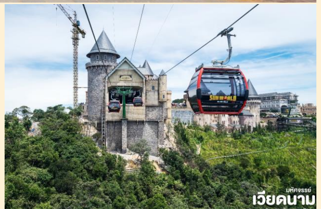
มัทซอร์รี่ เวียดนาม ดานัง • ฮอยอัน • บานาฮิลล์

นำท่านเดินทางสู่ บานาฮิลล์ เป็นที่ตากอากาศที่ดีที่สุดใเวียดนามกลางได้ค้นพบในสมัยที่ฝรั่งเศสเข้ามาปกครองเวียดนามได้มีการสร้างถนนอ้อมขึ้นไปบนภูเขาสร้างที่พักโรงแรมสิ่งอำนวยความสะดวกต่างๆเพื่อใช้เป็นสถานที่