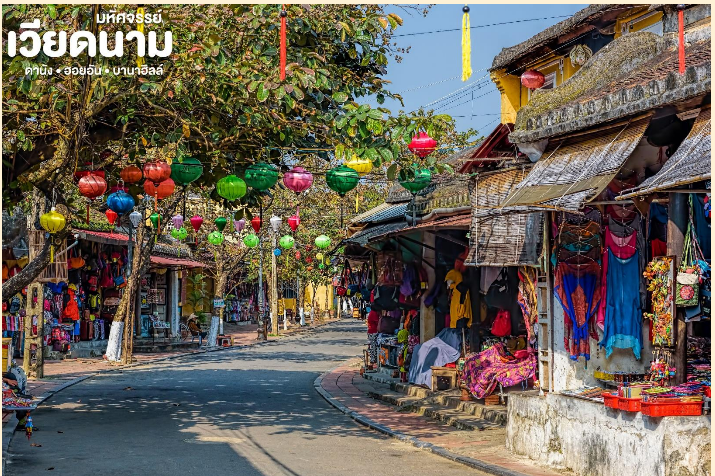
บ่คคจรรย เวียดนาม คานิง • ฮอยอัน • บานาฮิลล์

นำท่านเดินทางสู่ “เมืองโบราณฮอยอัน” (Hoi An) เมืองฮอยอันนั้นอดีตเคยเป็นเมืองท่า การค้าที่สำคัญแห่งหนึ่งในเอเชียตะวันออกเฉียงใต้และเป็นศูนย์กลางของการ แลกเปลี่ยนวัฒนธรรมระหว่างตะวันตกกับตะวันออกองค์การยูเนสโกได้ประกาศให้ฮอยอันเป็น เมืองมรดกโลกทางวัฒนธรรม เนื่องจากเป็นสถานที่สำคัญทางประวัติศาสตร์ แม้ว่าจะผ่านการบูรณะขึ้นเรื่อยๆ แต่ก็ยังคงรูปแบบของเมืองฮอยอันไว้ได้ นำท่านเดินทางด้วยรถโค้ชปรับอากาศเดินทางเข้าสู่ตัวเมืองฮอยอัน นำท่านชม วัดจีน เป็นสมาคมชาวจีนที่ใหญ่และเก่าแก่ที่สุดของเมืองฮอยอันใช้เป็นที่พบปะของคนหลายรุ่น วัดนี้มีจุดเด่นอยู่ที่งานไม้แกะสลักลวดลายสวยงามท่าน สามารถทำบุญต่ออายุโดยพิธีสมัยโบราณ คือ การนำรูปที่ขีดเป็นก้นหอย มาจุดทิ้งไว้เพื่อ เป็นสิริมงคลแก่ท่าน