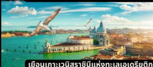
เยือนเกาะเวนิสราชนิแห่งทะเลเวเนตีย