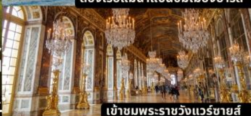
เข้าชมพระราชวังแวร์ซายส์