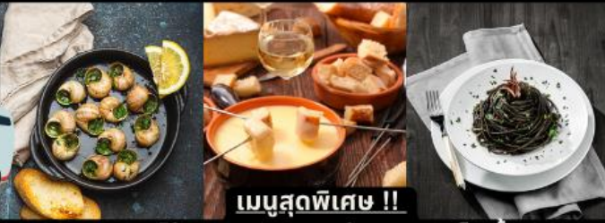
เมนูสุดพิเศษ !!

หอยแอสคาโต้ / / ฟองดูว์3อย่าง / สปาเก็ตตี้หมึกดำ