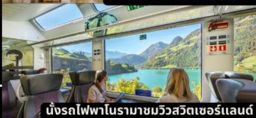
นั่งรถไฟความเร็วสูงในรามามหวิวัตเซอร์แลนด์