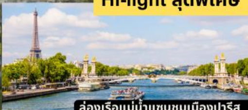
ล่องเรือแม่น้ำแซนชมเมืองปารีส