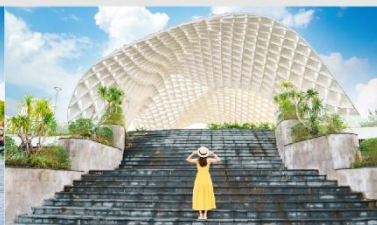
สวนเอเปค