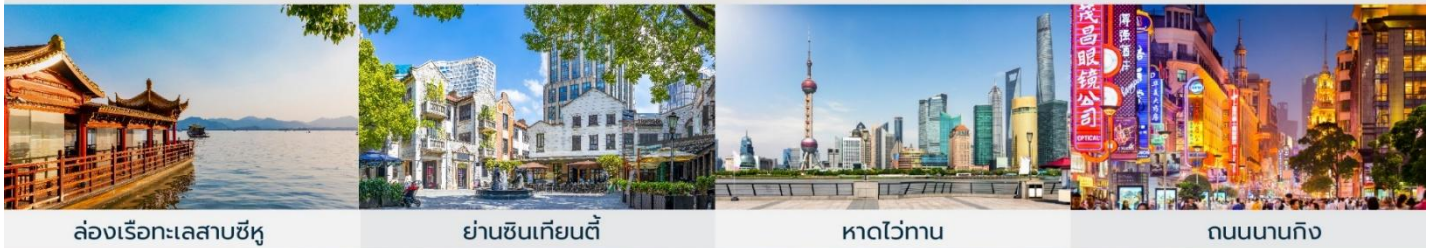
ล่องเรือทะเลสาบซีหู ย่านซินเทียนตี้ หาดไว่ทาน ถนนนานกิง