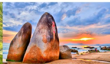
วนอุทยานสุดขอบฟ้า

*ทางบริษัทฯ ขอสงวนสิทธิ์ในการสลับโปรแกรมทัวร์ตามความเหมาะสมขึ้นอยู่กับสถานการณ์หน้างาน โดยคำนึงถึงผลประโยชน์ของลูกค้าเป็นสำคัญ