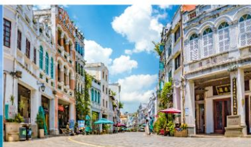
ถนนโบราณฉีโหลว