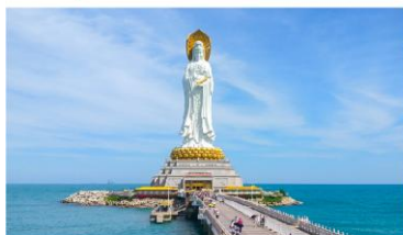
เจ้าแม่กวนอิมหนานซาน