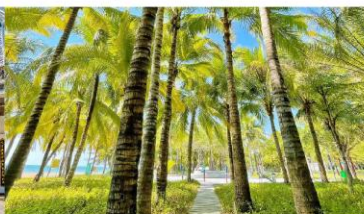
ทางเดินมะพร้าว