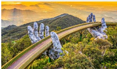
บานาฮิลล์