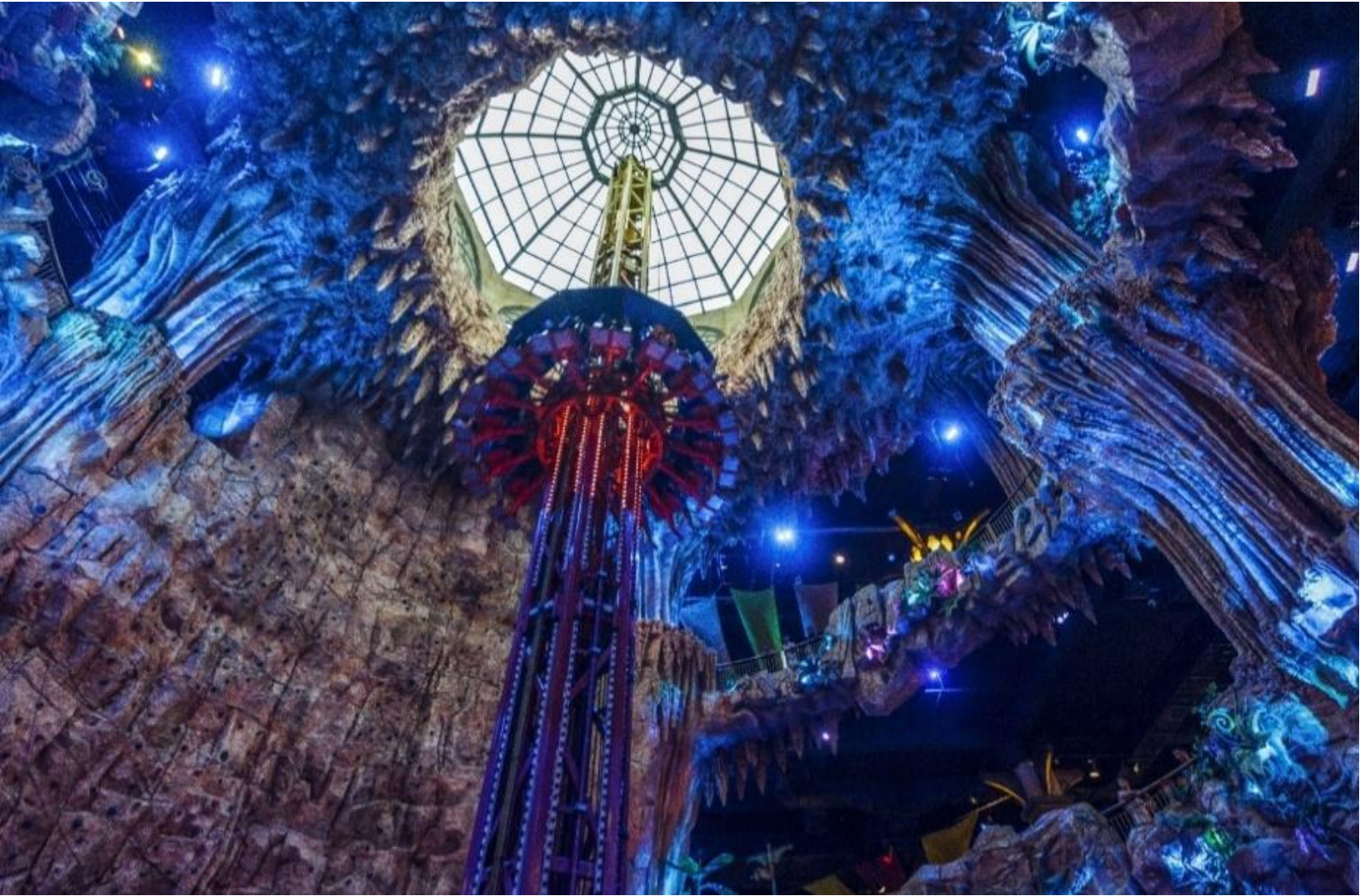
หรือ Alpine coaster)

โซนสวนสนุก The Fantasy Park ให้ท่านได้สัมผัสกับประสบการณ์ที่เต็มไปด้วยเสน่ห์แห่งตำนานและจินตนาการของการผจญภัยเครื่องเล่นในสวนสนุกของบานาฮิลล์ มีหลากหลายรูปแบบมีให้ท่านเลือก อาทิ เช่น โรงภาพยนตร์ 4D รถไฟเหาะแมงมุมที่ชวนให้ทุกท่านระทึกขวัญไปกับเครื่องเล่น รถราง หรือ Alpine coaster และอีกมากมาย นอกจากนี้ยังมีร้านช้อปปิ้งให้ท่านได้เลือกซื้อของที่ระลึกภายในสวนสนุกอีกด้วย (ราคาทัวร์รวมค่าเครื่องเล่นภายในสวนสนุกทุกเครื่องเล่น ยกเว้นพิพิธภัณฑ์หุ่นขี้ผึ้ง เครื่องเล่นที่ใช้ระบบหยอดเหรียญ และ รถราง