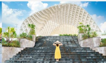
สวนเอเปค