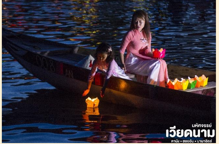
มัทศจรรย์ เวียดนาม ดานัง • ฮอยอัน • นานาฮิลล์

ที่พัก เข้าสู่ที่พัก TTC HOI AN 4* หรือเทียบเท่ามาตรฐานเวียดนาม (โรงแรมที่ระบุในรายการทัวร์เป็นเพียงโรงแรมที่นำเสนอเบื้องต้นเท่านั้น ซึ่งอาจมีการเปลี่ยนแปลงแต่โรงแรมที่เข้าพักจะเป็นโรงแรมระดับเทียบเท่ากัน)