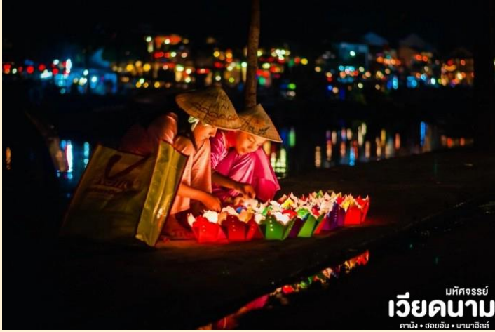
มัทศจรรย์ เวียดนาม ดานัง • ฮอยอัน • นานาฮิลล์

84/7 ถนนคูบอน แขวงรามอินทรา เขตคันนายาว กรุงเทพฯ 10230 TEL : 02-9430066 FAX : 02-943-0067 Licence No. 11/10930 E-mail : happyminute.travel@gmail.com http://www.happyminutetravel.com