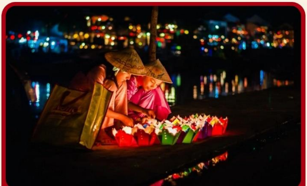
ล่องเรือลอยกระทงที่ฮอยอัน