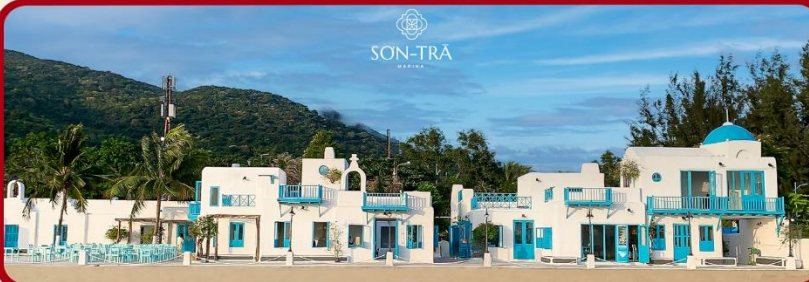
เช็คอินคาเฟ่ SON TRA MARINA