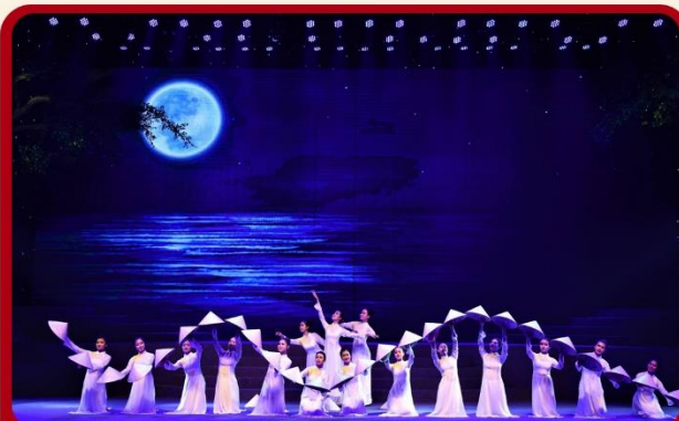
ชม CHARMING SHOW