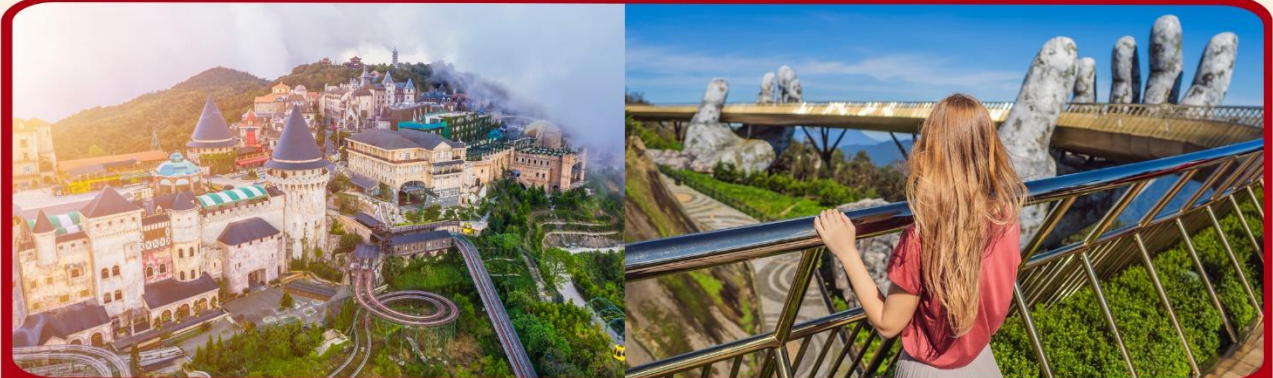
เที่ยวบานาฮิลล์เต็มวัน แบบจุใจ