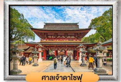
ศาลเจ้าดาโซฟู