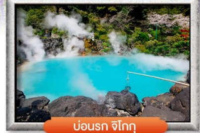
บ่อน้ำร้อน จิโกกุ