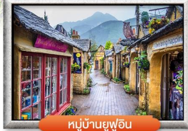
หมู่บ้านยูฟูอิน