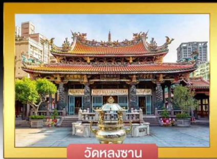
วัดหลงซาน