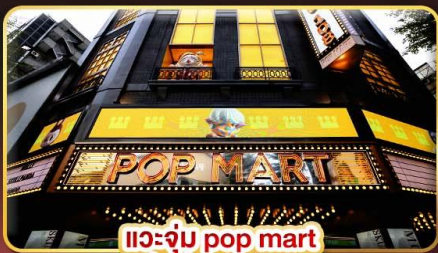
แวะจุ่ม pop mart ที่ฮิตที่สุดในซีเหมินติง