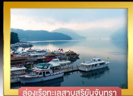
ล่องเรือทะเลสาบสุริยันจันทรา