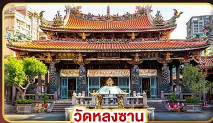
วัดหลงซาน