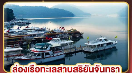
ล่องเรือทะเลสาบสุริยขึ้นจันตรา