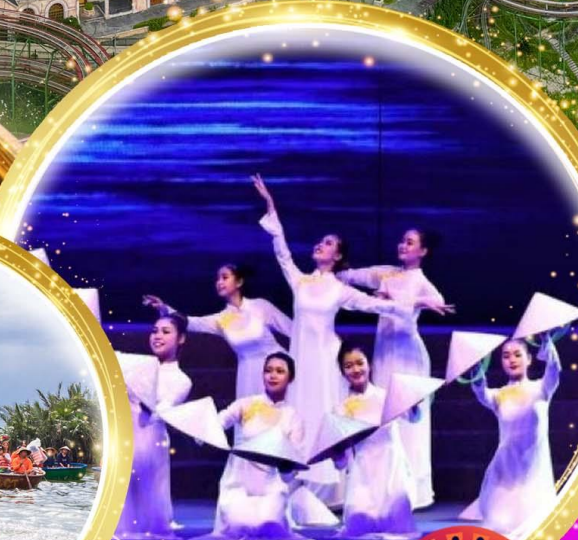
โชว์สุดอลังการ Charming at danang