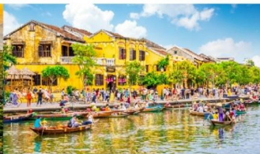
เมืองโบราณฮอยอัน