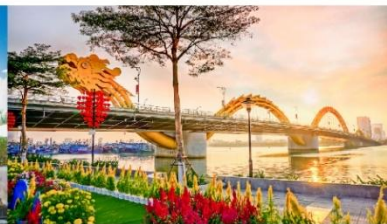
สะพานมังกร

*กรณีห้องพัkbานาฮิลล์เต็ม ขอสงวนสิทธิ์ในการเปลี่ยนวันเข้าพัก และปรับเปลี่ยนโปรแกรมโดยคำนึงถึงผลประโยชน์ลูกค้าเป็นสำคัญ