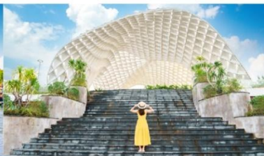
สวนเอเปค