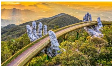
บานาฮิลล์