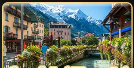
เยือนซาโมนิช พิชิตมงบลังก์