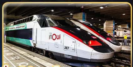
นั่งรถไฟความเร็วสูง PARIS - LYON

เดินทาง : 05-14 เม.ย. 68 | 29-08 พ.ค. 68