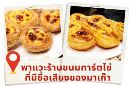
พาแวะร้านขนมมาร์ตไซ่ ที่มีชื่อเสียงของมาเก๊า

สถานที่นี้โดดเด่นไปด้วยสถาปัตยกรรมตะวันตก ตกแต่งด้วยเสาแบบโรมันและรูปปั้นนักบุญสำคัญของศาสนาคริสต์ แต่เดิมเป็นโบสถ์ที่ใหญ่ที่สุดในมาเก๊า สร้างขึ้นตั้งแต่ปี ค.ศ. 1602-1637 เพื่อเป็นศูนย์รวมแรงศรัทธาของชาวคริสต์ แต่แล้วก็เกิดเหตุไฟไหม้จากห้องครัวของโบสถ์เมื่อปี ค.ศ. 1835 ลุกลามไปทั่วจนทำให้ตัวโบสถ์พังทลาย เหลือเพียงส่วนหน้าประตูที่ยังไม่ถูกทำลาย จนกระทั่งปี ค.ศ. 1991 ที่มีการบูรณะซากประตูโบสถ์อีกครั้ง ทำให้ที่นี่กลายเป็นหนึ่งในสถานที่ท่องเที่ยวที่มีความสำคัญต่อประวัติศาสตร์มาเก๊า และได้รับการยกย่องให้เป็นมรดกโลก