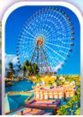
เมืองแฟนตาซี