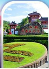
อุทยานหนานซาน