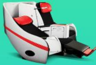
พรีเมียมแฟลตเบด