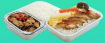
บริการอาหารร้อนบนเครื่อง ขาไป - ขากลับ