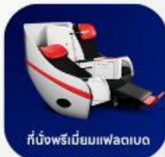
ที่นั่งพรีเมียมฟเลกซ์