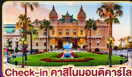
Check-in คาสิโนมอนติคาร์โล