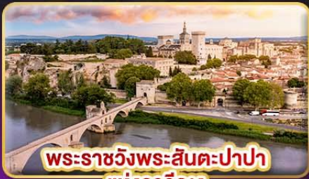
พระราชวังพระสันตะปาปา แห่งอวีญง