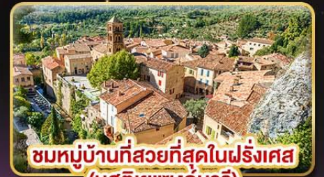
ชมหมู่บ้านที่สวยงามที่สุดในฝรั่งเศส (บูสตีเยแซงก์มารี)