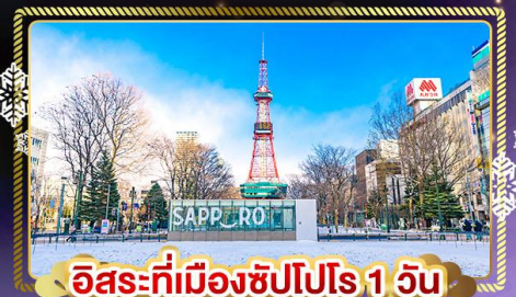
อิสระที่เมืองซัปโปโร 1 วัน