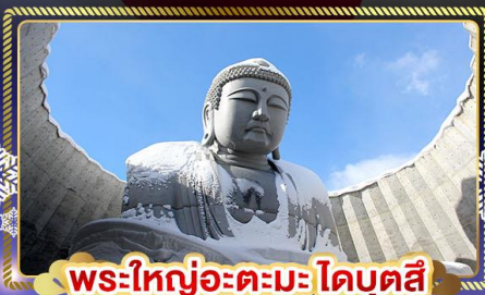
พระใหญ่อะตะมะโดบุตสึ