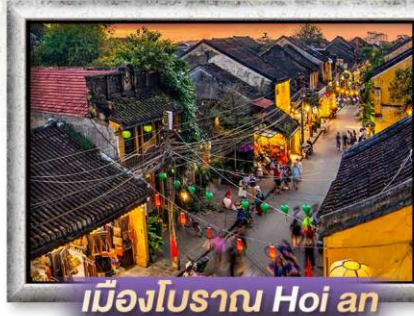
เมืองโบราณ Hoi an