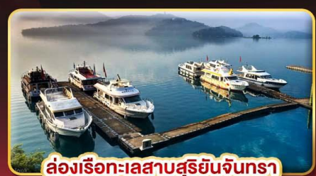
ล่องเรือทะเลสาบสุริยอันจินตรา