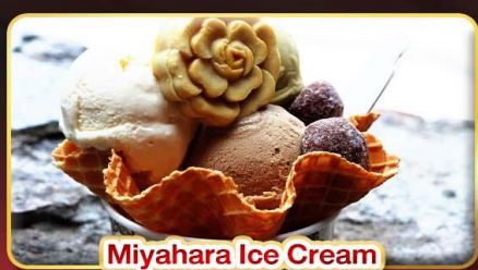
Miyahara Ice Cream

มหานครแห่งเมืองสี่สี "ไทเป" ช้อปปิ้งจุใจ 3 ตลาดกลางคืนชื่อดัง