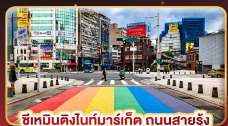
ซีเหมินติงไนท์มาร์เก็ต ถนนสายรุ้ง