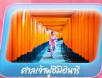
ศาลเจ้าฟุชิมิอินาริ