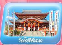
วัดโอสถคันนง

พักรูจิกิฟุ 1 คืน คันโซ 2 คืน นาโกย่า 1 คืน