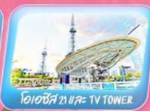
โอเอซิส 21 และ TV TOWER